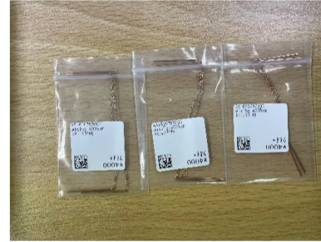
↑アクセサリー袋詰め