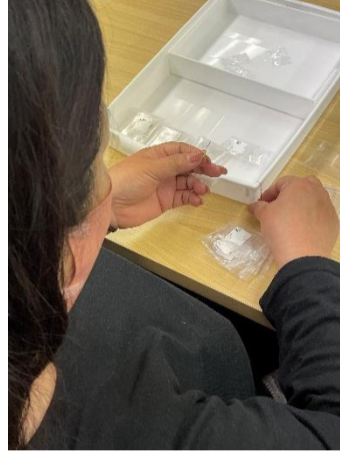
↑アクセサリー検品作業